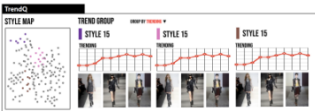
그림 5. TrendQ Interface

두 번째로 StyleQ 인터페이스이다. 사용자의 이미지에서 추출한 Attribute가 속해있고 그 중에서 가장 비슷한 스타일 3가지를 보여준다. 그리고 시스템 내부에서 정의한 스타일과 Attribute 조합을 테이블 형식으로 확인할 수 있고, 대표 스타일 정보를 제공해서 클러스터 스타일의 Bird's Eye View를 제공해준다. 이곳에서 정의된 스타일을 선택하고 다음 단계로 넘어갈 수 있고, 스타일을 선택하면 그 스타일에 맞는 Representative looks 이미지들이 나오게 된다.