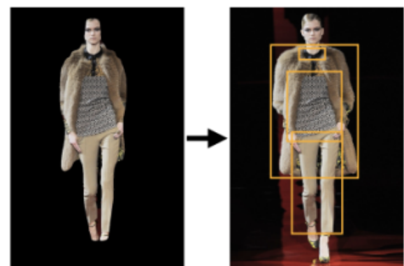
그림 2. ResNet101을 사용한 Object Detection

먼저 이미지에서 MaskRCNN [3]을 사용하여 사람과 옷을 제외한 배경 이미지를 모두 제거하는 작업을 시행하였다. 그 다음 Color-extraction 모델을 사용하여 이미지에서 가장 빈번하게 나타내는 색을 검출한다.