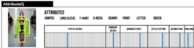
그림 3. AttributeQ Interface

인터페이스의 개발은 trend style의 적용까지의 각 업무 단계를 돕는 4개의 메인 시각화 단계를 갖고 있다. 인터페이스는 다음과 같다.