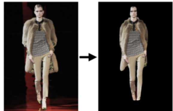
그림 1. MaskRCNN을 이용한 배경 제거

관련 선행연구에서 10명의 패션 전문가와의 인터뷰를 통해, 패션 디자인 속성과 프로세스에 대한 전반적 이해 뿐만 아니라, 트렌드 파악 작업에서 발생하는 정량적 패션 분석에 대한 어려움을 파악하였다 [2]. 이 문제를 해결하기 위해, 선행연구에서는 패션 디자인 프로세스에서 6단계로 구성된 패션 디자인 프로세스에서 사용하는 146개의 Attribute를 정의하였다. 우리는 146개의 Attribute를 차용하여, Attribute 조합 기반에 Fashion style 정량적 분석법을 고안하였다. 더 나아가, 정량적 스타일 정의 방법론 기반의 Trend analysis 및 Style adaptation을 응용, 개발하였다. 패션 이미지에서 Attribute를 찾는 방법은 다음과 같다.